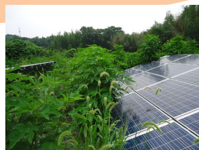
人が入りにくい場所も検査が可能