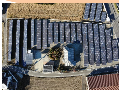
短時間で広範囲の検査が可能

上空からのドローン撮影により破損や汚れの確認、搭載したサーモカメラで異常個所を特定できます。